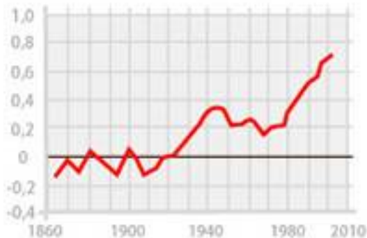
Variazioni in °C delle temperature terrestri mondiali

L'obiettivo generale del progetto WIZ è l'integrazione di concetti e procedure per la protezione e gestione sostenibile dell'acqua nei processi di pianificazione urbanistica, tenendo conto degli impatti del cambiamento climatico.